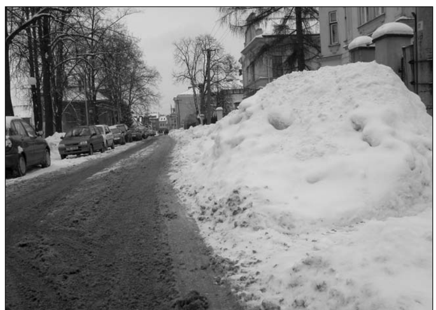
Nivnická ulice v letošní zimě.