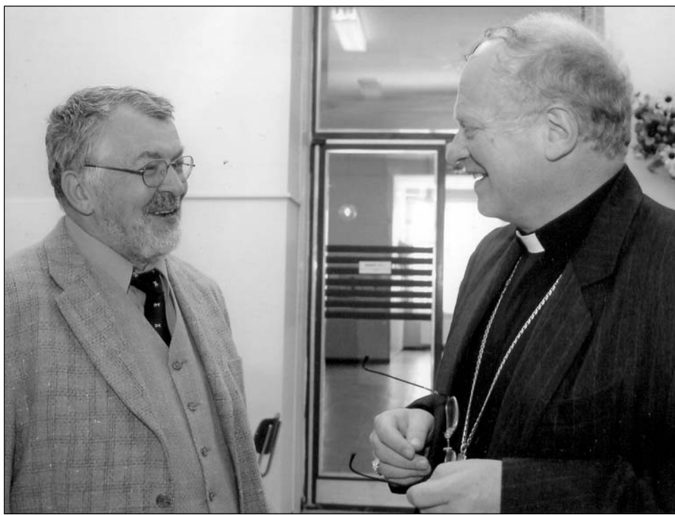
Při jedné z návštěv v BorsodChem MCHZ jsem se setkal i s biskupem Ostravsko-opavské diecéze.

Protože mezi taková města patří i Ostrava a její obvod Mariánské Hory a Hulváky, navázala naše radnice s asociací kontakt a do programu MIRIAD vstoupila. Spolu s námi se do něj zapojili zástupci Francie, Španělska, Řecka, Itálie, Holandska a za Českou republiku také Trínice.